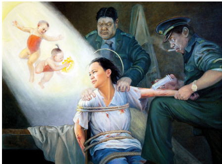
酷刑演示：打毒针（绘画）

播放。谁知几分钟后，来了个老检察官，不仅蛮横地拒收证据，还与一法院女人强行复印我的身份证，随后宣布清理现场，要非家属人员离开。