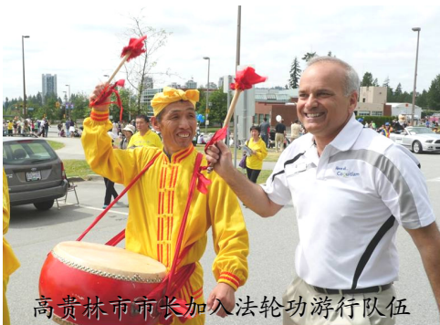
高贵林市市长加入法轮功游行队伍