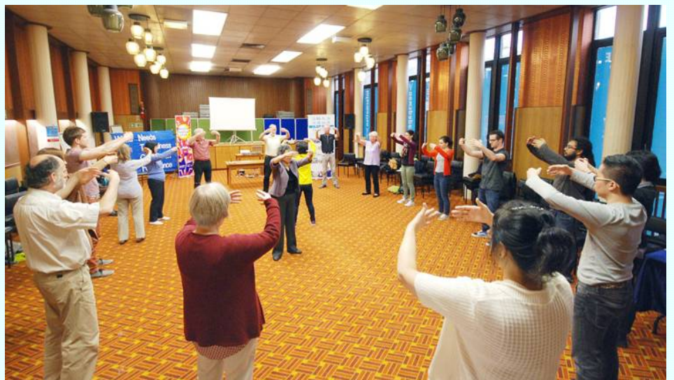
图:在苏格兰格拉斯哥西区图书馆里,人们聚精会神地学习法轮功功法

▲2014年以来,中共持续发起有计划、有预谋的大规模绑架事件。3至5月近1700名法轮功学员被绑架。