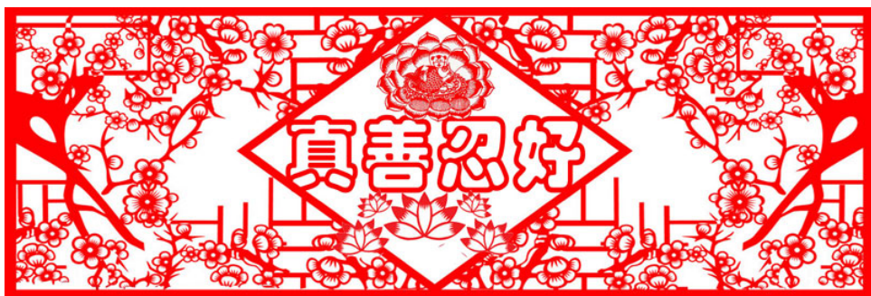
剪纸作品：《真善忍好》

侄女给他播放了师父的讲法录音，他听得挺认真，每天一讲。听到第三讲的那天上午 9 点多钟，大哥突然出现高烧，体温达到近 40 度，因为刚用过退烧药，不能再用药只能物理降温，用热水不间断地全身擦洗，到下午 3 点左右，体温降下来了。紧接着就出现了腹泻，便的都是脓血一样的东西，连续几次。一直到晚上 6、7 点钟才停止。烧也退了，人也疲劳了，大哥一觉睡到大天亮。他醒后对我说：这宿觉睡得可真香，从来都没有睡过这么好的觉。当他起床穿衣服时，发现脖子正了，一摸包块没了，脖子也能转动自如了。他当时非常惊讶，说：“我的病好了。”我说：“是你认真听师父讲法，师父给你清理了身体，把你的病给拿下来了。你昨天拉的那些东西，就是你那个病。”大哥开心地笑了。吃过早饭后，他自己主动听