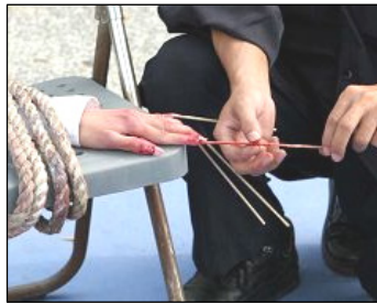
酷刑演示：竹签钉指甲