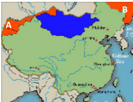
▲AB橙色部分为江泽民出卖的国土

1999年12月9日，江泽民和俄罗斯总统叶利钦签订了《关于中俄国界线东西两段的叙述议定书》，江泽民出卖了100多万平方公里的宝贵领土，相当于东北三省面积的总和。