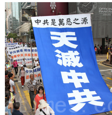
■ 香港声援“三退”游行

自 2004 年 11 月《九评共产党》在民间热传，让人们认清了中共谎言加暴力的邪恶本质，由此引发了退出党、团、队大潮。也许您说自己已经不交党费了，或者年龄过了算自动退队、退团了，但这些都不算数。因为人们加入中共时都举着拳头说把生命献给其党，现在必须有行为的表示，公开声明退出，才能废除那毒誓，才能在天灭中共时保平安。