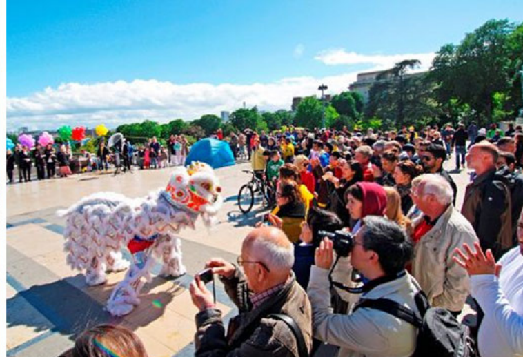
▲ 2014 年 5 月 11 日法国艾菲尔铁塔下法轮功学员的庆祝活动，吸引了大量游客。