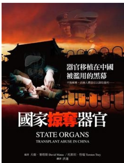
图:《国家掠夺器官》一书汇集多国医学专家、伦理学教授和国会议员等提供的大量事实、数据、证人证词及分析,揭示在中国发生的活摘器官恶行。

小资料:自1999年中共迫害法轮功,从2000年,中国大陆器官移植案例开始呈爆炸式增长,约在2003年至2006年是最高峰。