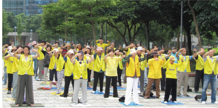
2014년 6월 14일 파룬궁수련생들이 타이베이 신의 광장에서 단체연공을 펼쳤다.

남편은 사업에 성공하고 친구들이 그룹처럼 모여들자 항상 깊은 밤에도 집으로 돌아오지 않았다. 조강지처인 나는 고독과 가정위기에 시달렸다. 나의 성격은 갈수록 거칠어져 부부간에 싸움이 빈번해졌다. 신체는 갈수록 망가져 위장병, 불면증, 삼차신경통, 결장염 등 20여 종의 질병으로 20여 년 동안 체중이 줄곧 35킬로그램 밖에 되지 않아 매일 전신이 무기력했고, 질병의 시달림으로 고통스럽게 지냈다. 잠시 친구 집에서 지낼 때 이웃의 파룬궁