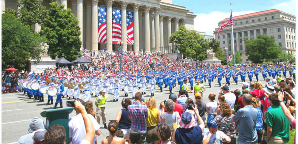
2014 年美国首都国庆游行，观众欢迎法轮功队伍并拍摄这独具特色的场面。

加拿大官方多次在联合国人权委员会上发言，关注法轮功受迫害及中共强摘器官之事。在公开反对迫害