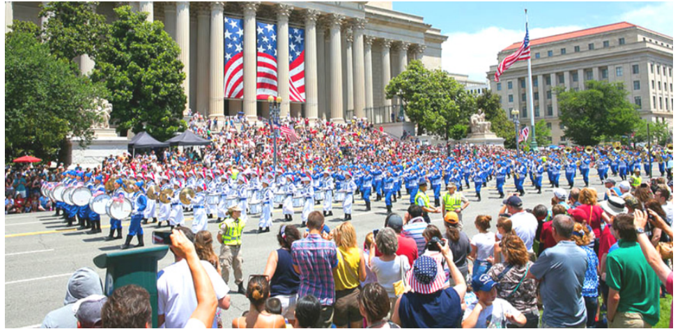
2014 年美国首都国庆游行，观众欢迎法轮功队伍并拍摄这独具特色的场面。

加拿大官方多次在联合国人权委员会上发言，关注法轮功受迫害及中共强摘器官之事。在公开反对迫害