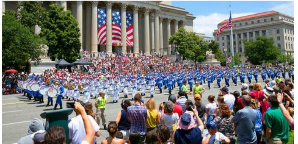
2014年美国首都国庆游行，观众欢迎法轮功队伍并拍摄这独具特色的场面。

加拿大官方多次在联合国人权委员会上发言，关注法轮功受迫害及中共强摘器官之事。在公开反对迫害