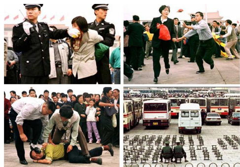
■ 在天安门法轮功学员被警察殴打。这才就是中国警察的“执法”。

那个拿“灭火毯”的警察要等“王进东”喊完了口号，才用毯子蒙住他的头。这不符合中国的国情，中国的警察不是这样执法的。我可以描述一下具有中国特色的警察应该怎样做：先一脚将“王进东”踹倒，然后用脚踩住他的头，如果“王进东”企图喊口号，那还得马上堵住他的嘴。这才是中国式的执法，所以这段视频放给外