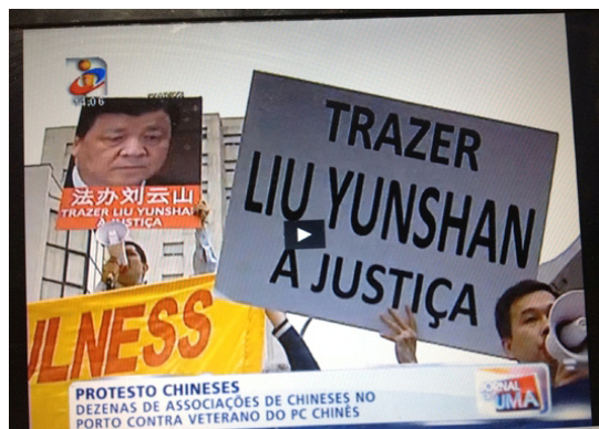
▲葡萄牙多家电视台及媒体对法轮功的抗议活动进行了采访报道。

■ 2014年6月13日，芬兰市政厅前，当迫害法轮功的元凶之一、中共政治局常委、前中宣部部长、“610”办公室（中共专门迫害法轮功的非法组织）的主要成员刘云山下车时，法轮功学员对刘云山喝道：“法办刘云山！”刘云山闻声浑身一震，随即惊慌逃入市政厅里。此后刘云山出访欧洲四国（丹麦、芬兰、爱尔兰和葡萄牙）期间，“法办刘云山”的呼声相伴，令刘云山如过街老鼠，仓皇逃窜。