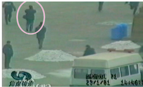
■ 图中的男子在军警间从容拍摄，引起国际社会质疑。（央视自焚录影截图）

2003年10月放假期间，北京被迫拆迁的居户在天安门自焚后，人们发出这样的疑问：“为什么这次自焚记者没有拍到任何镜头？警察为什么没有及时拿出灭火器和灭火毯？而2001年“天安门自焚”，在一分钟之内就扑灭火焰？警察各种消防器材齐全？记者长镜头、短镜头、近距离特写一应俱全？”这些都说明2001年1月的“天安门自焚”是中共为迫害法轮功而策划的阴谋。