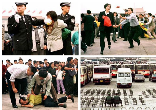
▲ 美联社照片：在天安门法轮功学员被警察殴打。这才是中国警察的“执法”。

那个拿“灭火毯”的警察要等“王进东”喊完了口号，才用毯子蒙住他的头。这不符合中国的国情，中国的警察不是这样执法的。我可以描述一下具有中国特色的警察应该怎样做：先一脚将“王进东”踹倒，然后用脚踩住他的头，如果“王进东”企图喊口号，那还得马上堵住他的嘴。这才是中国式的执法，所以这段视频放给外国人看反倒觉得很正常，但中国人看了就太假了。再说了，那火都灭了，还用毯子蒙那么一下子起什么作用呢？