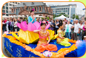
▲德国 - 法兰克福