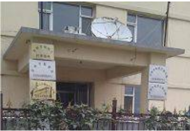
吉林市沙河子洗脑班

6 月，梅河口市“610 办公室”开始绑架法轮功学员到洗脑班，洗脑班设立在梅河口市海龙镇废弃的原双兴乡中学旧址。◇