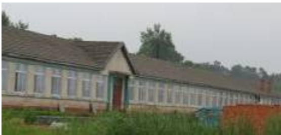
梅河口双兴洗脑班（原双兴乡中学旧址）