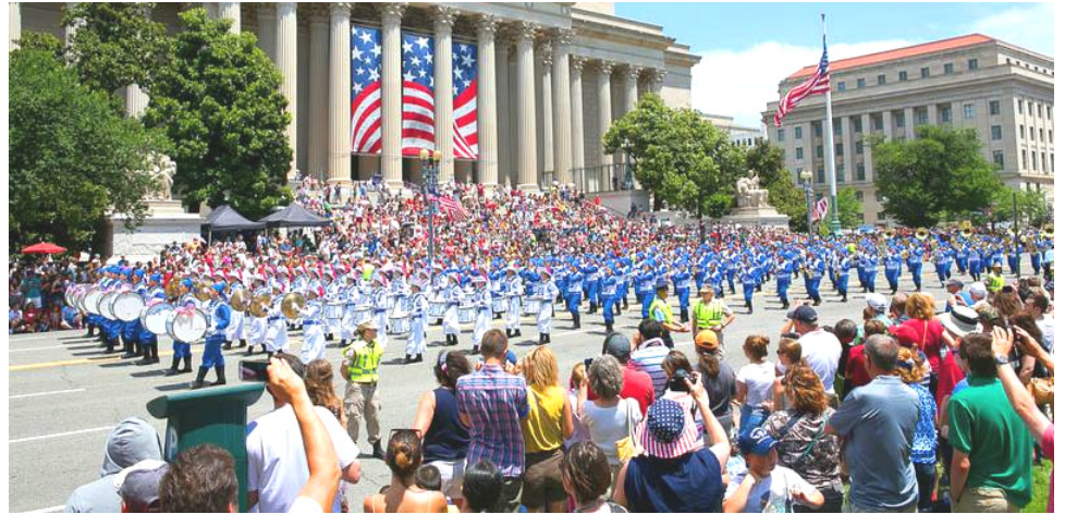
2014年美国首都国庆游行，观众欢迎法轮功队伍并拍摄这独具特色的场面。

加拿大官方多次在联合国人权委员会上发言，关注法轮功受迫害及中共强摘器官之事。在公开反对迫害