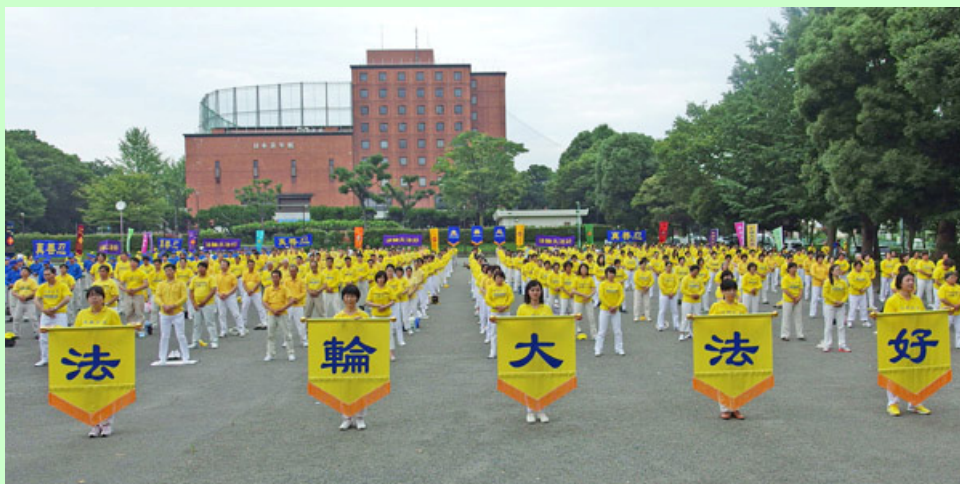
二零一四年亚洲法会第二天，法轮功学员举行集体大炼功

十五年来，法轮功学员坚持理性反迫害，讲真相，为的是使人们找回正信、拥有美好未来。十五年的风雨历程，法轮大法的真相与美好已经深入人心，在大纪元退党网站上声明退出中共的人数每天都是以万为单位的增长。◇