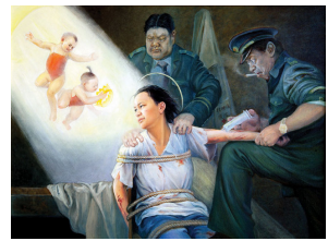
酷刑演示：打毒针 （绘画）