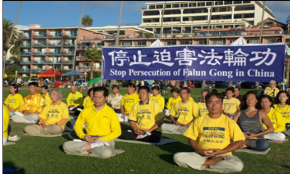
纪念和平反迫害十五周年，圣地亚哥法轮功学员在当地著名的拉荷亚海湾风景点集体炼功，传播真相。许多游人驻足了解真相。

师，因为不放弃信仰，被单位开除。二零零三年他被非法关进广州市第一劳教所。他回忆：“到了劳教所的第二天，他们就对我实施一种叫‘扎粽’的酷刑折磨，就是把双臂绑到身后，然后全身捆绑，像包粽子一样，紧紧地绑起来。这样后过不了几分钟整个人会昏过去。”