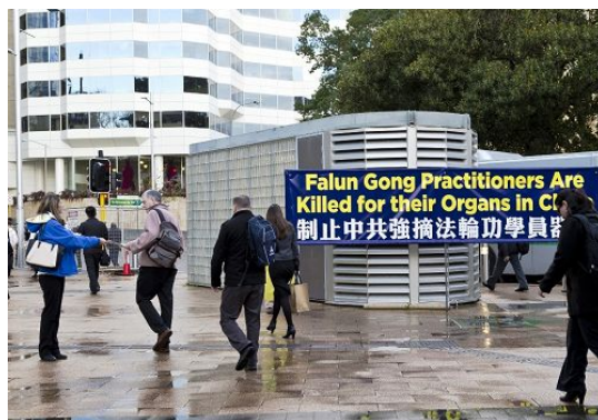
图：西澳法轮功学员在 Esplanade 火车站的出口打大型横幅

法轮功学员打出了多个大型的“制止中共强摘法轮功学员器官”中英文横幅。当来往行人看到横幅上的大字：“中国法轮功学员因被强摘器官而遭杀害”