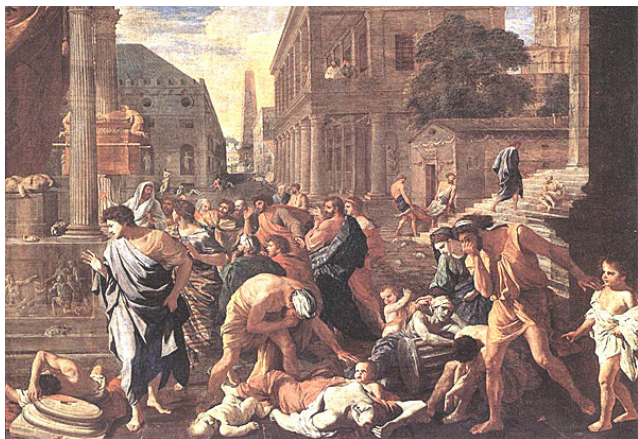
油画《阿什杜德的瘟疫》，刻画了罗马第四次大瘟疫的可怕情景。