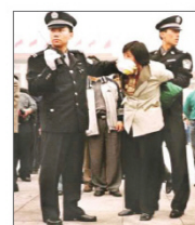
◆ 迫害法轮功 (1999-今)