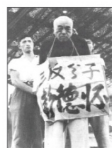
◆ 文化大革命 (1966-1976)