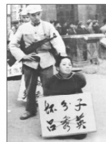
◆ 三反五反 (1951-1952)