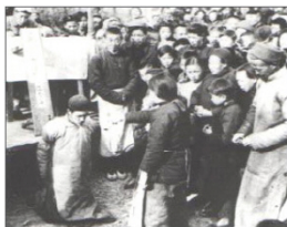
◆ 土改 (1950-1952)

济南公安和媒体这种贼喊捉贼的咆哮，只是中共苟延残喘的表现与垂死挣扎的表演。同时也更加让更多的人知道了真相，就是：全民反邪教一定要反中共这个大邪教。◇