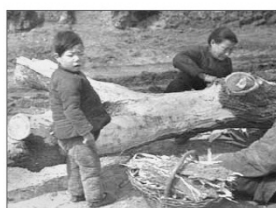
◆ 大跃进导致大饥荒 (1959-1961)