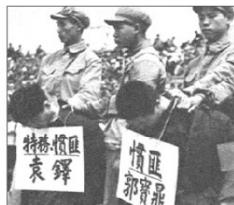
◆ 镇压“反革命” (1950-1952)