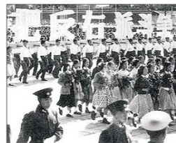
◆ 反右 (1957-1958)