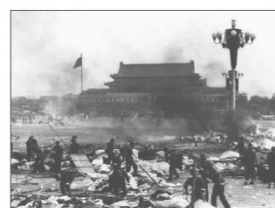
◆ 六四屠城 (1989)