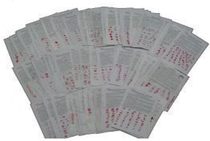
▲唐山及周边16130位村民部分签名