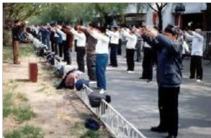
吉林市 1999 年迫害之前的法轮功炼功场

十五年来，吉林市、县法轮功学员被非法绑架、拘留、劳教、判刑、洗脑，流离失所、致残、致死，失踪，数以千计，有 74 位在派出所、看守所、劳教所、监狱等地直接被迫害致死。由于信息被中共封锁，目前尚无法准确查证，更多的罪恶还被掩盖着。◇