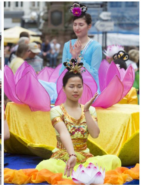
左：2014 年法兰克福文化节上，法轮功欧洲天国乐团通过市政厅所在地罗马广场；右：花车上的法轮功功法演示