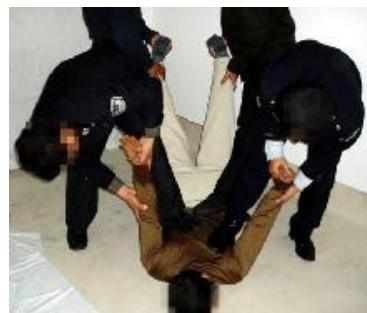
洗脑班酷刑示意图：（左）毒打 （右）围殴

觉，昏迷过去。这些恶徒还把头盔扣在学员头上用棍子猛击头盔；往头上浇凉水把全身棉衣湿透后拉到阴暗处冷冻。打完后高额罚款，交不上的继续毒打。仅一次罚款就达 70 多万元：150 多人中，普通班每人被罚 4000 元，其中 15 人被罚款 8000 元，连老人、残疾人都不放过。罚完后原先写给的收条全部被收回毁掉。