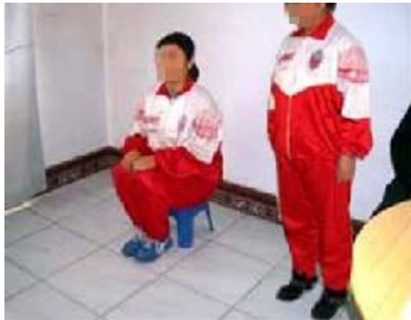
酷刑演示：罚坐小板凳

狱警还选出年轻凶狠的罪犯充当“打手”。这些人多是杀人，吸毒以及黑社会的犯罪分子。他们对法轮功学员采取熬夜、长久面壁罚站、连续起蹲、毒打、竹筷子杵肋骨、牙签扎手指等等的邪恶手段，强制法轮功学员转化。他们紧闭门窗，不准其他