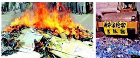
▲迫害伊始中共大量销毁法轮功书籍

法轮功明确指出杀生和自杀都是犯罪。法轮功的核心著作《转法轮》中讲：“杀生这个问题很敏感，对炼功人来说，我们要求也比较严格，炼功人不能杀生。”《法轮大法 悉尼法会讲法》问答部分：“弟子：那第三个问题就是书里边说到杀生问题。杀生是一种很大的罪业，一个人他自杀算不算罪呢？师：算罪。”