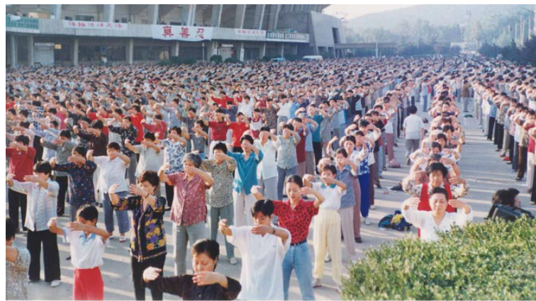
1998年近万名济南法轮功学员在山东体育中心广场集体炼功。

就在我暗中筹划这个计划时，4月份的一天，为了寻找治病方法，我偶然地走进了法轮功的九天学习班。听着李洪志师父讲的高深而又易懂的道理，我感到