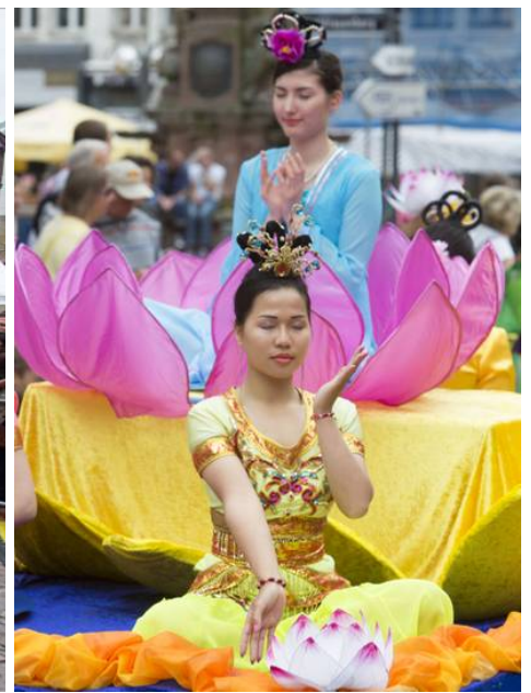
左：2014年法兰克福文化节上，法轮功欧洲天国乐团通过市政厅所在地罗马广场；右：花车上的法轮功功法演示