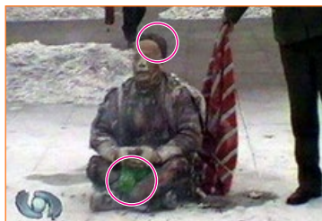
头发和塑料瓶子烧不坏？