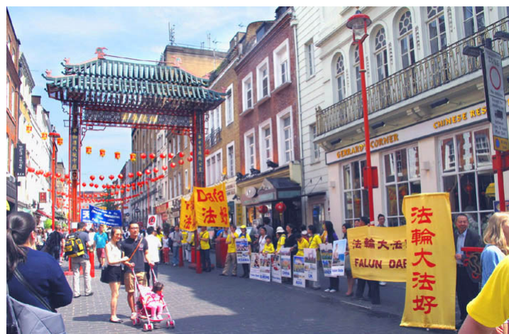
英国伦敦唐人街上的“真相长城”（2014 年 7 月）

相活动，如果你们到了那里，可要多看看真相资料呀，也别阻拦孩子们看，这是他们的权利，对吧？