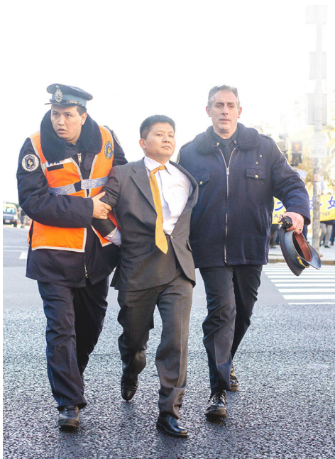
阿根廷警方逮捕中共大使馆的一名官员

期间，中共雇佣的当地华人超市协会及福建同乡会打手们对法轮功学员的合法活动进行骚扰，这些人与警察发生冲突，疯狂殴打阿根廷人，使在场的警察、官方人员和民众无法接受。中共的破坏行动以失败告终。阿根廷警方派警力隔离中共打手，又派警察骑摩托车护送法轮功学员到习近平车队的必经之处。7月19日，阿根廷警察将攻击法轮功学员的中共大使馆副武官逮捕。警方向法轮功学员透露，虽然此人是中共的外交官，但也要将其拘捕。◇