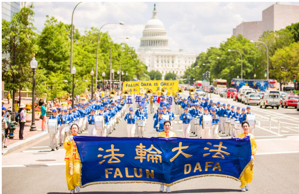
美国首都宾夕法尼亚大道上的法轮功游行队伍