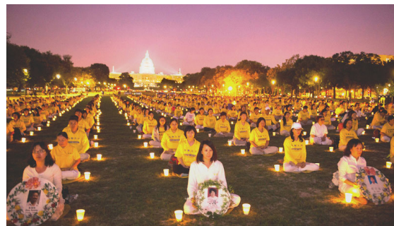
美国国会山前烛光夜悼