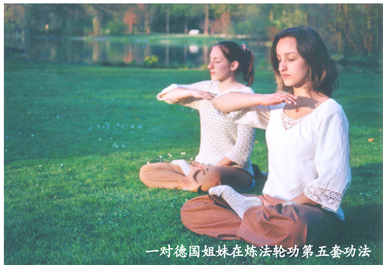
一对德国姐妹在炼法轮功第五套功法