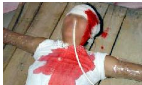
中共酷刑：固定灌食

在此期间，吃不饱饭，水煮青菜没有油，人也日渐消瘦。后他花钱定了几次菜，每次定菜他都分一半给同监室的一个死囚，没过多久，他和那个死囚两人都出现了双目视力下降，看不清东西，心跳过速，身体发麻，四肢无力等症状，这时才有所知觉，吃的饭菜可能被下药。