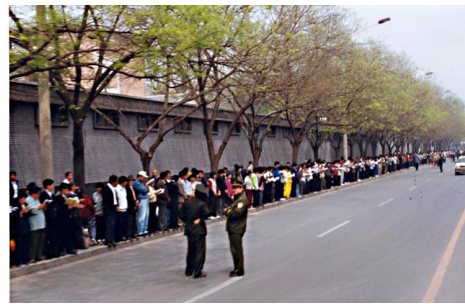
1999 年 4 月 25 日上访现场

代丽国 1995 年开始学法轮功，炼了 20 多天，折磨她十多年的类风湿性关节炎、腰椎盘突出等几种病痛全部消失了。