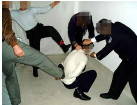
酷刑演示：拳打脚踢