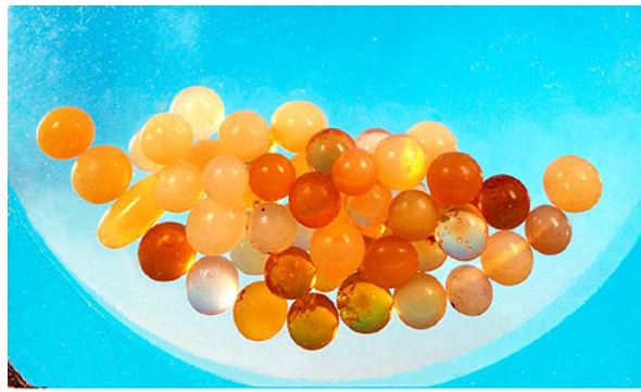
释迦牟尼佛七彩髻舍利 Shakyamuni Buddha Seven Colour Head Shrine

牟尼佛血舍利（1988 年发现）；山东汶上宝相寺释迦牟尼佛牙舍利（1994 年发现）。