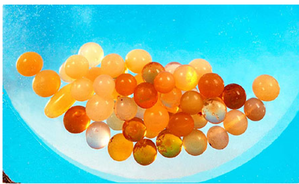
释迦牟尼佛七彩髻舍利 Shakyamuni Buddha Seven Colour Head Shrine

牟尼佛血舍利（1988 年发现）；山东汶上宝相寺释迦牟尼佛牙舍利（1994 年发现）。