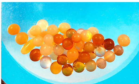
释迦牟尼佛七彩髻舍利 Shakyamuni Buddha Seven Colour Head Shrine

牟尼佛血舍利（1988 年发现）；山东汶上宝相寺释迦牟尼佛牙舍利（1994 年发现）。