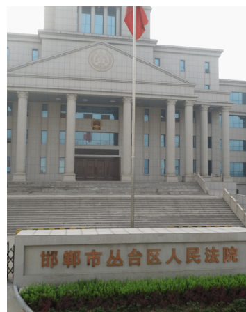
邯郸市丛台区法院

中共的劳教制度在世界上臭名远扬，最后不得不以“结束”收场，而丛台区检察院的“公诉人”还拿出来作为“证据”，被旁听者讥讽：是怕中共干的坏事被人们忘记吗？◇