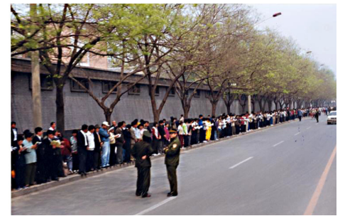
1999 年 4 月 25 日上访现场

代丽国 1995 年开始学法轮功，炼了 20 多天，折磨她十多年的类风湿性关节炎、腰椎盘突出等几种病痛全部消失了。