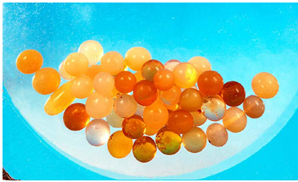
释迦牟尼佛七彩髻舍利 Shakyamuni Buddha Seven Colour Head Shrine

牟尼佛血舍利（1988 年发现）；山东汶上宝相寺释迦牟尼佛牙舍利（1994 年发现）。