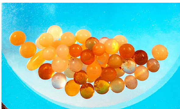
释迦牟尼佛七彩髻舍利 Shakyamuni Buddha Seven Colour Head Shrine

牟尼佛血舍利（1988 年发现）；山东汶上宝相寺释迦牟尼佛牙舍利（1994 年发现）。