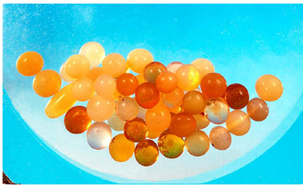
释迦牟尼佛七彩髻舍利 Shakyamuni Buddha Seven Colour Head Shrine

牟尼佛血舍利（1988 年发现）；山东汶上宝相寺释迦牟尼佛牙舍利（1994 年发现）。