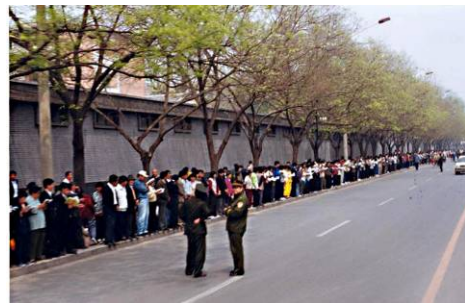
1999 年 4 月 25 日上访现场

代丽国 1995 年开始学法轮功，炼了 20 多天，折磨她十多年的类风湿性关节炎、腰椎盘突出等几种病痛全部消失了。