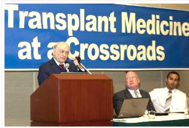
加拿大著名人权律师大卫·麦塔斯

【明慧网】2014 年 7 月 29 日晚, 在世界移植器官大会在旧金山召开期间, 在由“医生反对强摘器官”国际组织主办的“移植医学的十字路口: 呼唤良知”研讨会上, 加拿大著名人权律师大卫·麦塔斯透露, 在《血腥的器官摘取》一书中被调查的一名中国医生, 一周前被中共当局以“滥用器官移植”的罪名逮捕。尽管中共没有使用“活