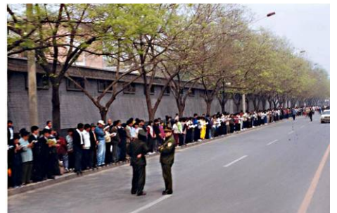
1999 年 4 月 25 日上访现场

代丽国 1995 年开始学法轮功，炼了 20 多天，折磨她十多年的类风湿性关节炎、腰椎盘突出等几种病痛全部消失了。