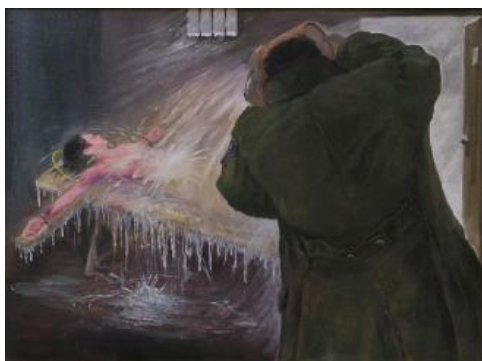
中共酷刑示意图：泼冷水

接着他们逼我写“六书”，我不写，他们就把复印好的别人写的现成的让我抄，我不抄，她们就求我说。你信你搁心里信，写“六书”也都是假的，糊弄糊弄也就不找你麻烦了，队长也能交差了。那算啥呀，不行你就先不用都写，少写两个，别让我们费劲啊……她们在我耳边整天不停的