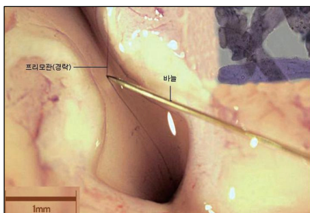
韩国研究人员在连结兔子大脑与脊髓部位发现经络管道

“我研究免疫学40多年，第一次亲眼观察到了淋巴管里还有其它管道系统，我感到非常震惊。”世界著名免疫学专家、大韩民国国家级明星