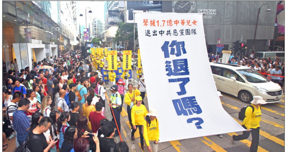
2014 年 7 月 20 日，香港法轮功学员反迫害大游行。

产主义为祸中华近百年，中共建政后，发动历次运动，八千万中国人被迫害致死，使中华大地生灵涂炭。