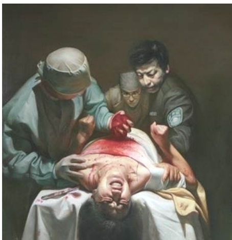
■ 沈阳市苏家屯最早被曝光：中共活摘法轮功学员器官贩卖。

来警车把法轮功学员秘密拉走的事，被拉走的一般都是坚定信仰不“转化”、被隔离的法轮功学员，这些被接走的法轮功学员，大多下落不明。