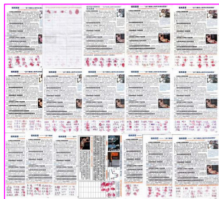
图：张家口人谴责中共活摘器官暴行的部分签名

而签名后的家人都得了福报。签名前其嫂子患有肝硬化、胃出血等多种疾病，并且三天两头的住医院，签名前她刚到北京做了手术，因她的病随时都有生命危险，医院还让她一个月后到北京复查，因住院治疗她家还借了好多的外债，自打签名反迫害后，其嫂子不但没到北京复查，而且身体一天比一天好，她家还还清了外债。兄弟签名后买卖兴旺。过去其外甥好长时间找不上工作，签名没几天，就找到了工作。她的小外孙期末