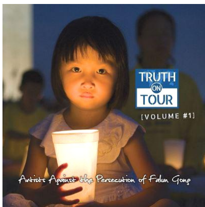
2014 年 7 月，白宫草坪，烛光夜悼 纪念迫害中失去生命的法轮功学员