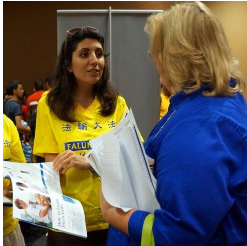
法轮功学员在招新会上介绍法轮功

一位西人男学生走近了法轮大法社团的摊位，他对法轮功学员说：自己非常支持法轮大法，在很早之前就签名谴责中共活摘法轮功学员器官这种魔鬼行为。我现在很想做对你们有帮助的事情！