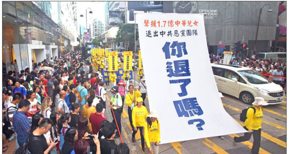
2014年7月20日，香港法轮功学员反迫害大游行。

产主义为祸中华近百年，中共建政后，发动历次运动，八千万中国人被迫害致死，使中华大地生灵涂炭。