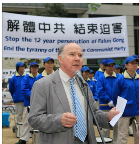
澳洲国家公民委员会主席彼得·韦斯莫

术可以立即进行，如果出了差错，两周之内将提供新的器官！我下意识地反应：这是不可能的，谁也做不到这一点！我本人来自医学背景，我好几个亲兄弟都是医生，移植器官要严格的组织配型，所以我知道，在以良好的医疗制度著称的澳大利亚，如果一