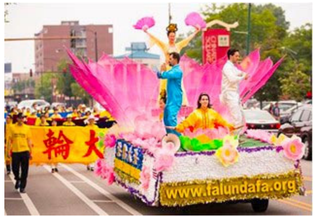
图:二零一四年七月二十六日,来自美国中部地区十个州的法轮功学员聚集芝加哥中国城,展开声势浩大的游行活动。当天,中国城的居民和各族裔游客都目睹了游行的宏大场面,倍感震撼。