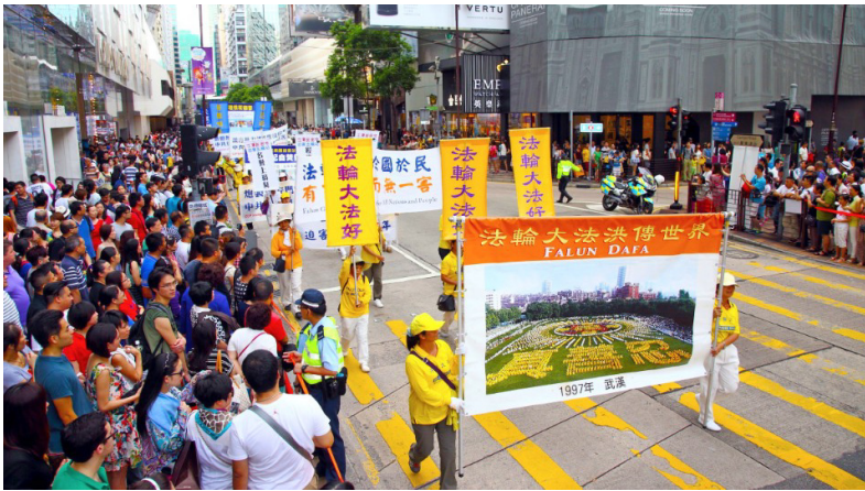
图:二零一四年七月十九日、二十日香港法轮功学员连续两天举行声势浩大的反迫害大游行,呼吁解体中共、结束迫害、法办元凶。香港多位立法会议员到场支持,大陆游客纷纷围观、拍摄,深受震撼。